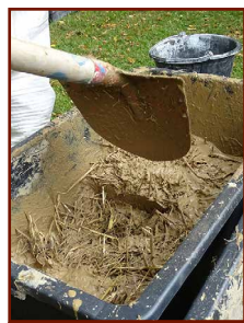
Lehm Stroh Wasser